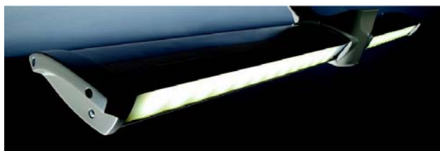
> Stores Roche Habitat éclairés à LED par NEOLUX