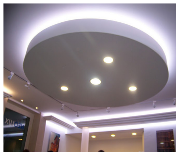
▼ Intégration discrète et esthétique dans l'environnement architectural