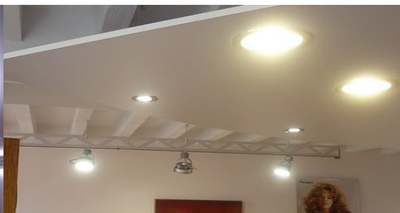
▼ Éclairage général d'ambiance